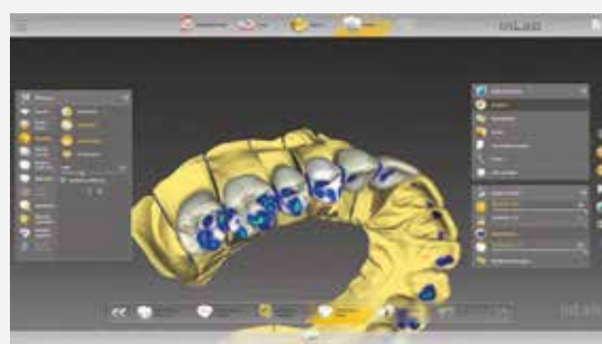
inLab CAD SW

L'integrazione di Cercon ML nel database dei materiali del software CAD fa risparmiare tempo nel processo di progettazione e considera automaticamente le proprietà del materiale - per risultati più affidabili e riproducibili.