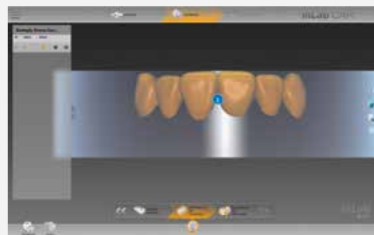
inLab CAM SW

I dischi Cercon Multilayer sono memorizzati nel database dei materiali e possono essere assegnati rapidamente e direttamente al lavoro di fresatura desiderato tramite l'inserimento del codice QR. Per un posizionamento ottimale del disco (allineamento estetico degli strati e resistenza nella zona della dentina), questo può essere spostato e ruotato manualmente in tutte le direzioni.