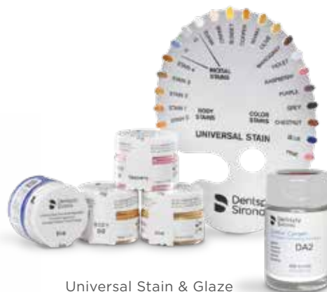
Universal Stain & Glaze